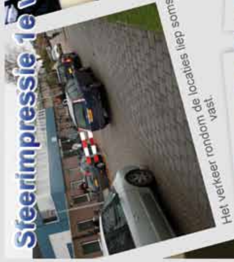
Het verkeert rondom de locaties liep soms vast.

Vormgeving: Veiligheidsregio MWB