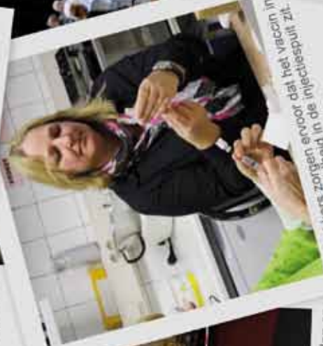
De optrekkers zorgen ervoor dat het vaccijn in de juiste hoeveelheid in de injectiespuit zit.