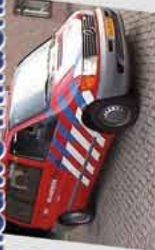
Voorafgaand aan de massavaccinatie heeft de brandweer alle locaties geïnspecteerd op veiligheid.