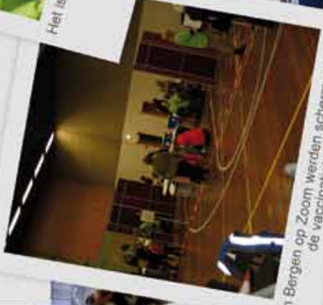
In Bergen op Zoom werden schermen tussen de vaccinatietafels gezet.