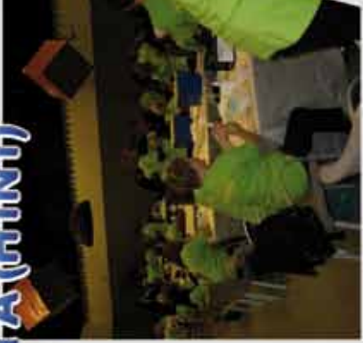
De vaccinatietafels in Etten-Leur.