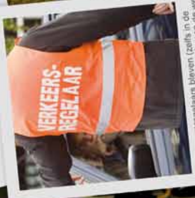
Verkeersregelaars bleven (zelfs in de stormende regen) vriendelijk iedereen de weg wijzen.