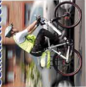
De politie hield de verkeerssituatie in de gaten.