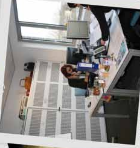
Het Actiecentrum Vaccinatie druk met telefoontjes.