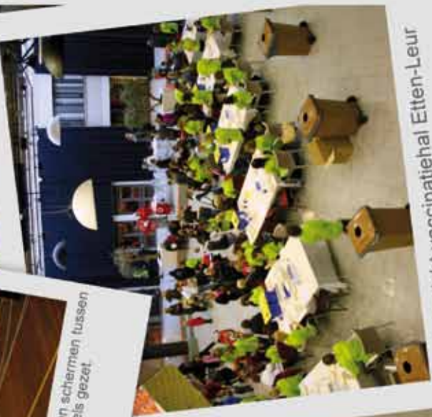
Overzicht vaccinatiehal Etten-Leur