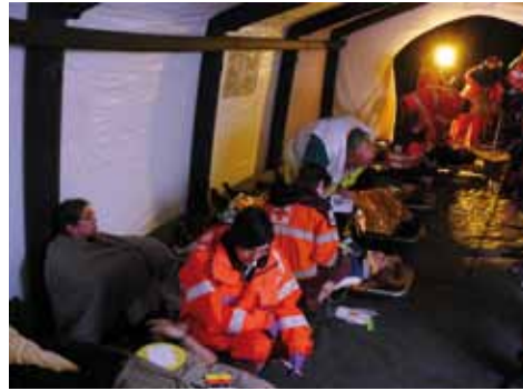
De Belgische collega's aan het werk

De Inspecteur Rampbestrijding van de Inspectie voor de Gezondheidszorg was bij deze oefening aanwezig en sprak van een waardevolle oefening, met dank aan de vrijwilligers en professionals, van zowel Belgische als Nederlandse zijde.